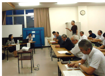
新庄区長が市長へ現状の防災対応の在り方について質問されました。

1. チャンスを生かす！中部縦貫自動車道が延伸・開通するなどの絶好の機会を逃さない。