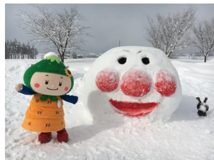
(JAテラル越前大野東支店のみなさん制作の雪像)

2月9日に、さかだに雪まつりの反省会を兼ねた実行委員会が開催され、雪まつりの収支決算報告や事業報告が行われました。様々な意見交換がなされました。それを踏まえて次回の雪まつりには、新しい風、若い力、地区民の主体的な企画を呼び込みたいというねらいのもと、雪まつりの実行委員さんを公募することになりました。仲間とともに阪谷を盛り上げたい、雪まつりでこんな企画をやってみよう、などの思いやアイデアをお持ちの方は、ぜひ、実行委員になって実現してみませんか！ 我こそはという方は、4月末までに阪谷公民館までご連絡ください。お待ちしております！