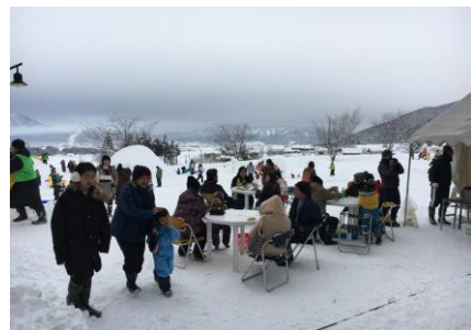
(にぎわう屋外販売ブース)