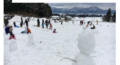
思い思いに遊ぶ家族連れ