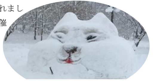
雪像コンクール参加作品

直前の降雪のおかげで開催できる運びとなり、初日は天候に恵まれたくさんの来場者があり、スターランドさかだにを会場としての雪まつり、大成功に終わったのではないでしょう。朝からボランティアで協力くださいました皆様、大変お疲れ様でした。