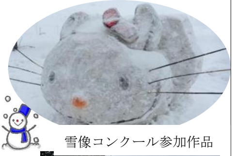
雪像コンクール参加作品