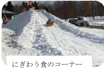
にぎわう食のコーナー