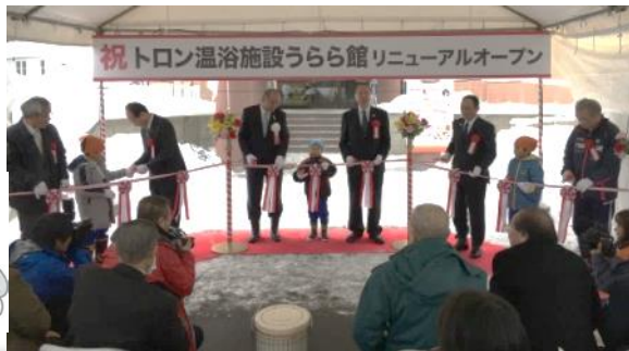
テープカットシーン