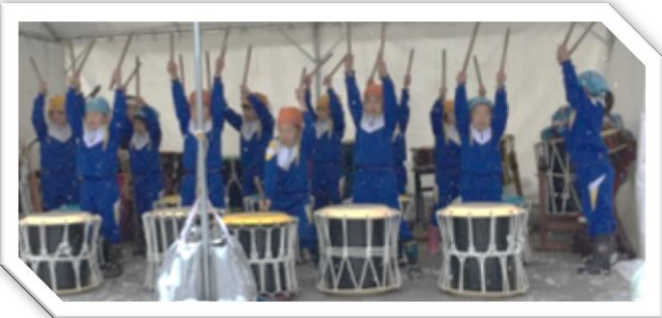
オープニングイベントの和太鼓演奏 (阪谷小1、2年生)