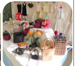
持ち寄りバイキングと、素晴らしい作品の数々