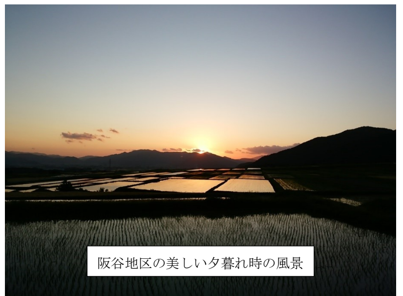
阪谷地区の美しい夕暮れ時の風景

すると、突然強い風に背中を押され、まるで頑張れと励まされているような気がして少し元気ができました。