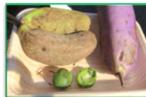
（写真はアケビとサルナシ）