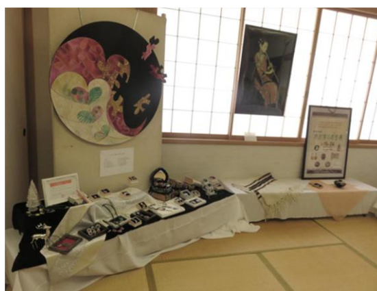
「わたしのお宝・マイコレクション」では珍しい品や思い出の品が並びました