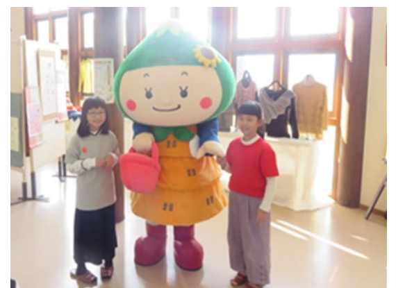
Tシャツプリント体験で、自分だけの「さかずきんちゃんTシャツ」を作りました。