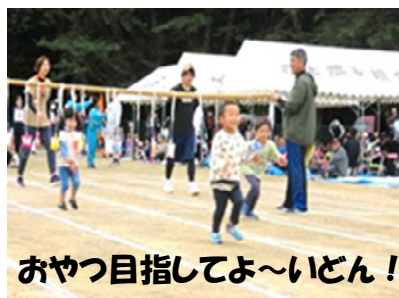
おやつ目指してよ〜いどん!