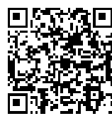
申し込みフォーム