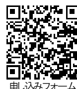
申し込みフォーム