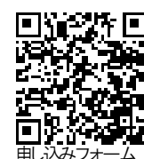
申し込みフォーム