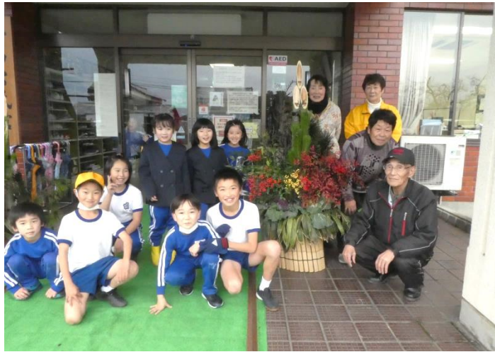
※コスモス会が作成した門松と一緒に

高砂コスモス会の皆さま本当にありがとうございました。地区の皆さまとともに良い一年を過ごすことができそうです。来館の際、ぜひ門松をご覧ください。