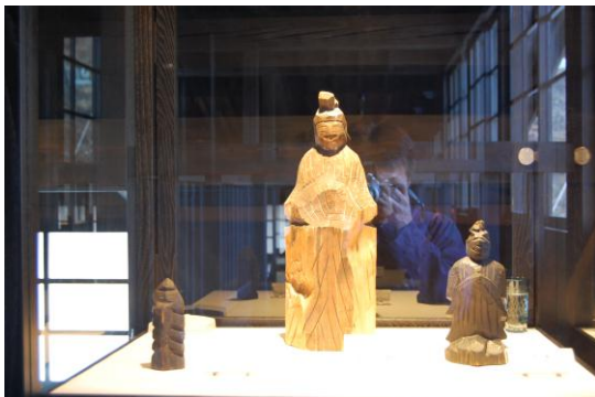
展示されていた円空仏

下呂温泉では、飯降山で修行をしたと言われる泰澄ゆかりの彫刻師「円空」の仏像展示を観覧。