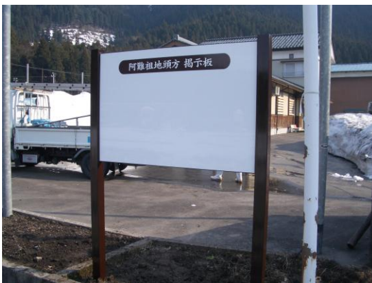
阿難祖地頭方区に設置した掲示板

また地域コミュニティ支援事業と称して、小山地区内15集落に地域づくりの機運を高める