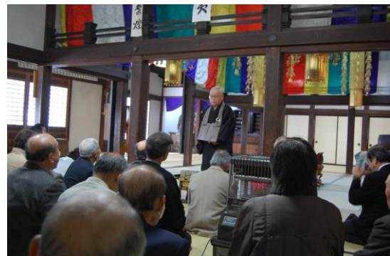
素玄寺にて説明を聞く参加者