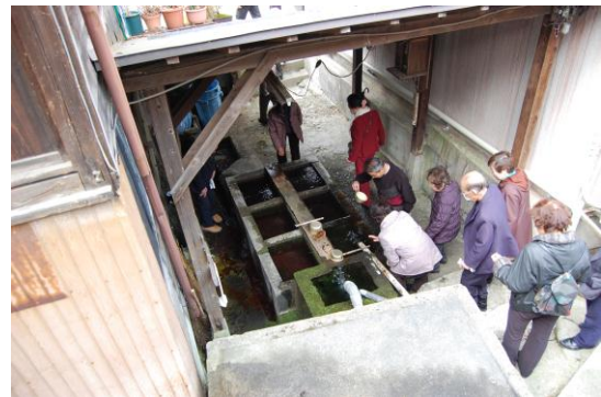
神岡地区の共同水場

視察研修旅行では、訪問地である神岡地区において、小山荘にあった面谷鉦山を開発した糸屋彦次郎の功績を肌で感じるとともに、大野に似通った共同水屋を視察できました。