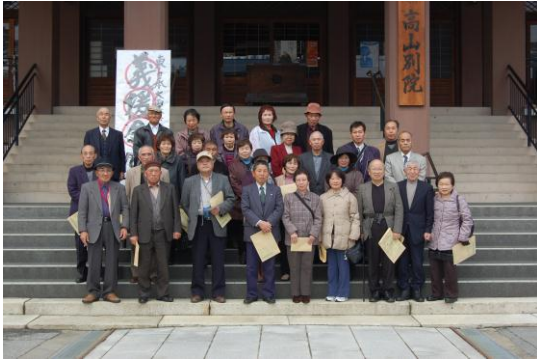
視察研修旅行参加者の皆さん

4回シリーズで行った歴史講座は、将来、小山の歴史や文化について語る語り部の育成を目標に、縄文時代から現代に至るまでの小山地区の歴史や地区内の神社仏閣に関する内容として、各回にそれぞれ約30人、延べ120人余りの参加をいただきました。