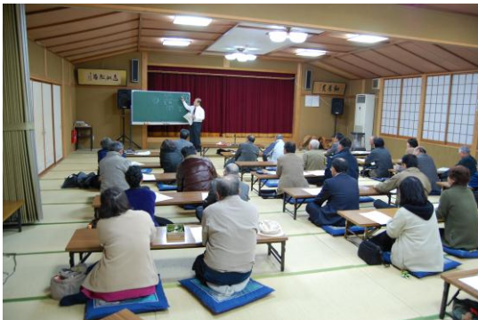
第1回歴史講座（縄文～室町）

4回シリーズで行った歴史講座は、将来、小山の歴史や文化について語る語り部の育成を目標に、縄文時代から現代に至るまでの小山地区の歴史や地区内の神社仏閣に関する内容として、各回にそれぞれ約30人、延べ120人余りの参加をいただきました。