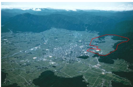
赤枠で囲われたところが小山地区

面積は、東西 2 キロメートル、南北 4 キロメートルの約 8 平方キロメートル。その位置は、大野市の南西部、市街地に隣接し、大型ショッピングセンターなどの商業施設が立地しています。