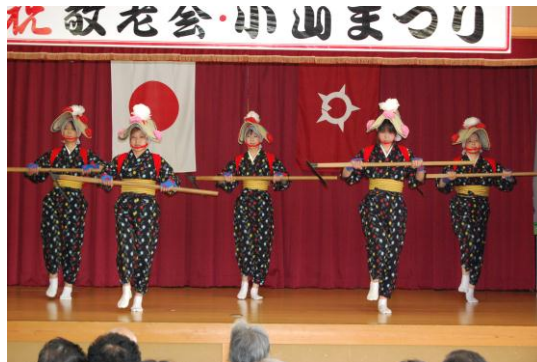
小山まつりで披露される小山鉦踊り

小山をよくする会では、地区民を対象とした夏祭りや秋祭り、花壇コンクールなどを行うほか、地域の伝統芸能である小山鉦踊りの保存・継承活動にも取り組んでいます。