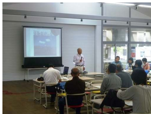
観察会オープニング