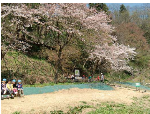
保育園児の散歩風景

亀山の植物を紹介する冊子を作成し、散策する人たちに貸し出して、亀山の植物に対して興味を持ってもらうことができた。