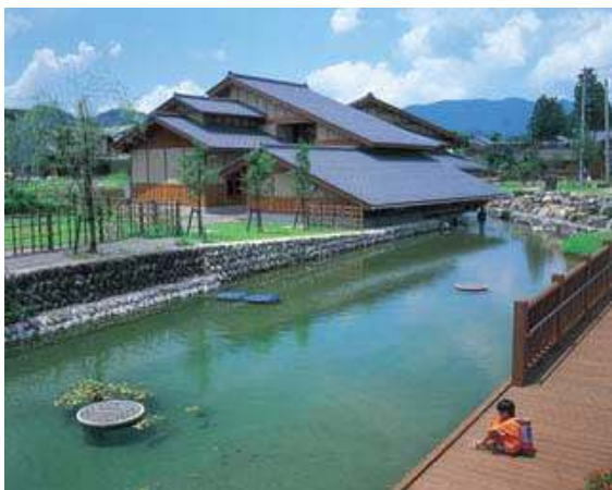
平成の名水百選「本願清水」といとの里

広大な森林を持つ本市は湧水が多く、当地区には名水百選にも選ばれている「御清水」をはじめとする湧水地がいくつもあり、古くから地下水を生活用水として利用してきた。この地下水は、現在でも多くの家庭が飲み水などに利用しており、この地ならではの豊かな水文化を育んでいる。