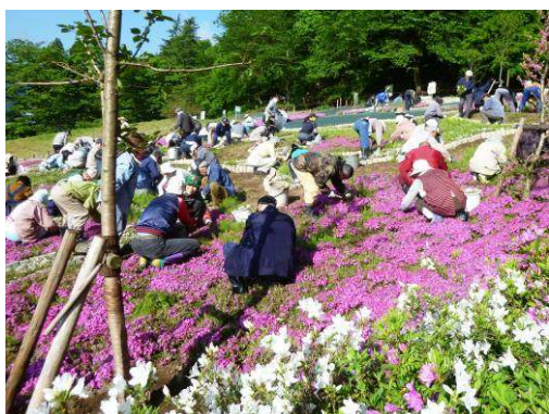
シバザクラの植栽の様子

亀山東側緩斜面を斜面の部分的なオープンカットにより「お花見広場」として、シバザクラや芝生を植栽し整備した。