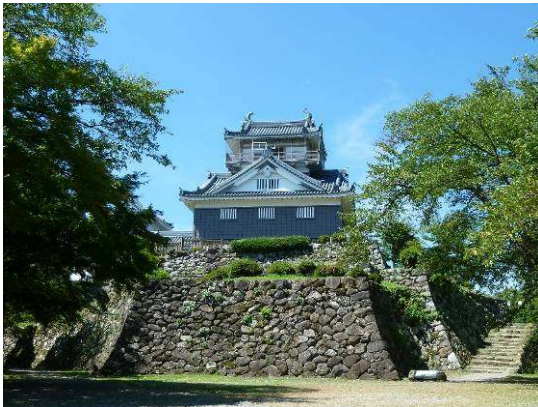
亀山の頂に建つ越前大野城