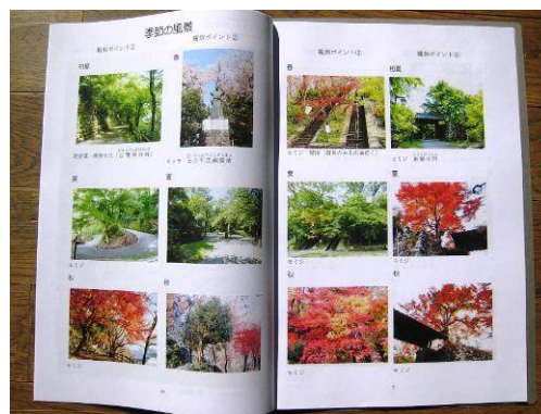
冊子『亀山の四季と史跡』