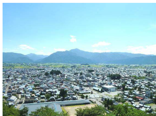
亀山から見た市街地

明治22年の町村制施行により、5つの小区がまとまって大野町が誕生した。大野町は、昭和29年の町村合併により大野市の一地区となって現在に至っている。