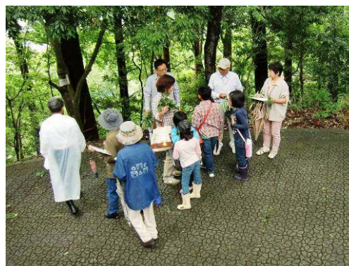
講師の説明を聞く参加者