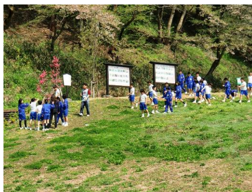
小学生の野外観察

百間坂エントランス道下の斜面整備と亀山の植物の観察会を継続し、亀山の更なる魅力アップを図るとともに、柳神社境内のお馬屋池周辺を整備し、市が整備を計画している義景公園から御清水、新堀清水とあわせ、亀山に至るまでを観光周遊のルートとして確立する。