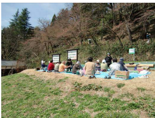
花見を楽しむ人たち