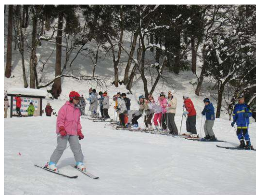
ちびっこゲレンデ