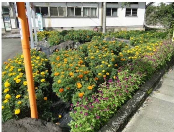
公民館近くの花壇

越前おおの・九頭竜花桃回廊プロジェクトにあわせて、地区住民が共同作業し、地域を花でいっぱいにすることを目的として実施した。