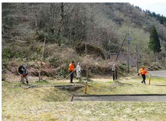
花桃の育成管理（雪囲い作業）