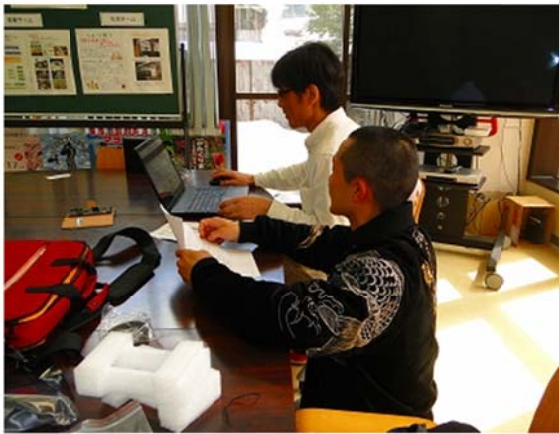
「和泉自治会」のHP作成

「ここに住み続けられるために」を基本的な考え・共通の思いとして、自ら考え、行動する自立した地域づくりを推進していきたい。