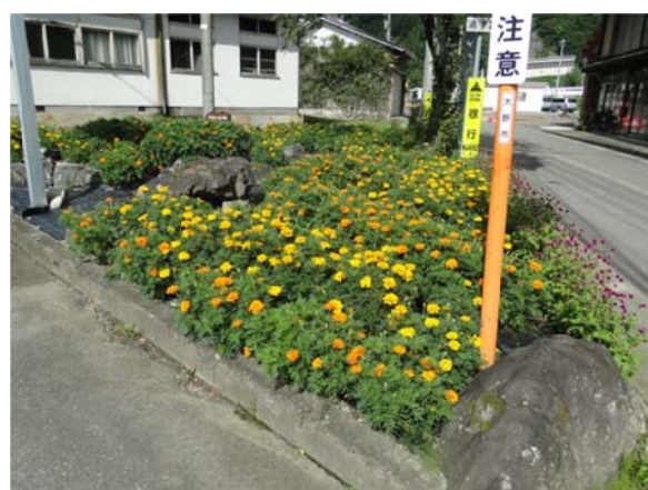
「道端花いっぱい運動」の花壇