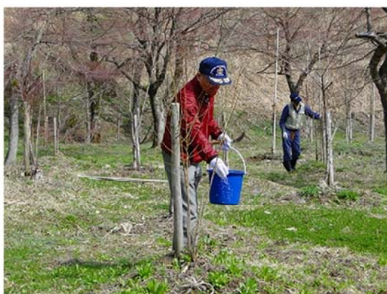
花桃の育成管理（追肥作業）