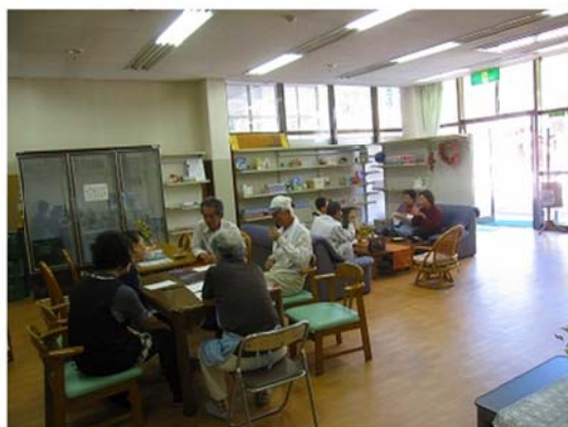
「より処」日頃の様子