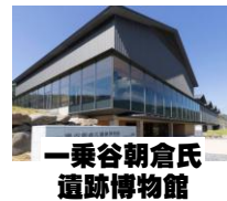
一乗谷朝倉氏遺跡博物館