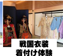
戦国衣装着付け体験