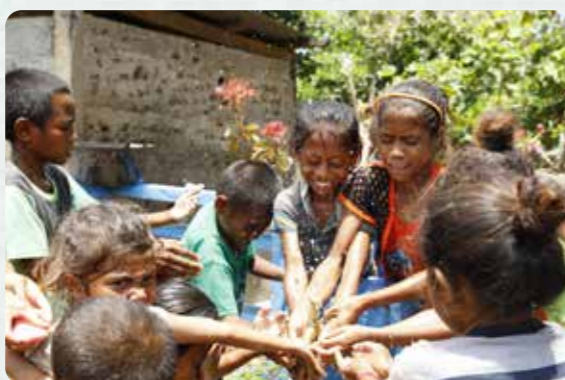
安全な水の確保が厳しい東ティモール民主共和国と絆を結び、 ユニセフ(国連児童基金)を通じて給水施設の建設を支援

大野市は今日、ブラジルで開催される国際会議、 「世界水フォーラム」に参加します。 かつて大野市民が集い、話し合い、困難を乗り越えたあの時のように、 世界中の人々との「井戸端会議」で、 「水への恩返し」を世界とともに進めるための提言を行います。