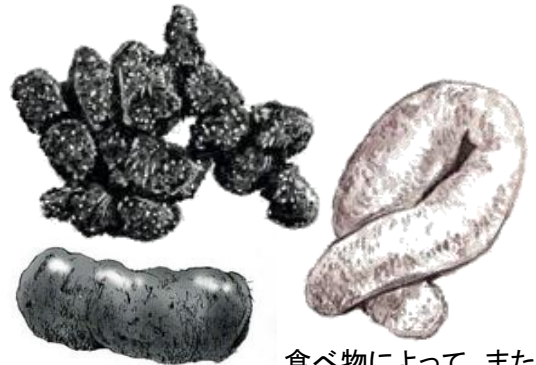
ツキノワグマの糞