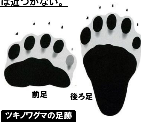
ツキノワグマの足跡

近くには必ず母グマがいます。子グマがかわいいからと近づいたりすると、母グマが突然現われて人を攻撃することがあります。