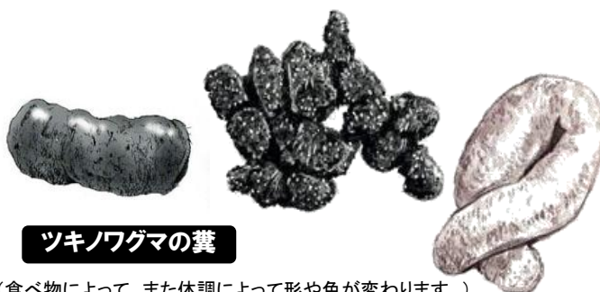
ツキノワグマの糞

雨や風の音、霧などにより、クマも人の気配に気づかず至近距離まで接近することがあります。