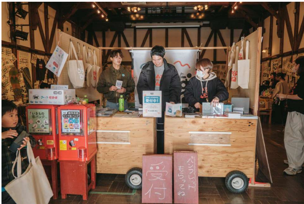
過去のプログラムで参加していた関西大学の学生スタッフ