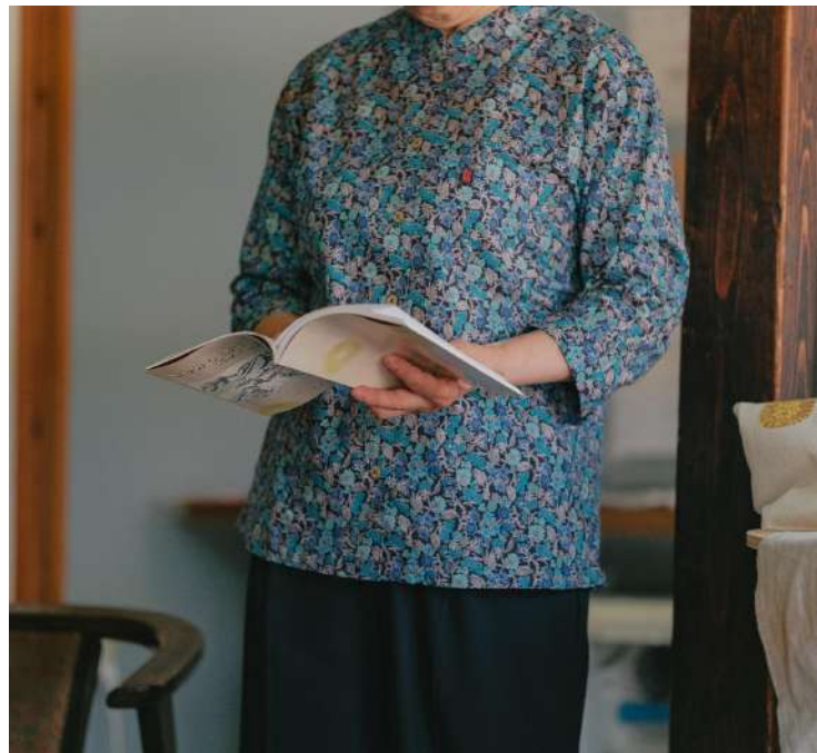
語りを聞きに行く