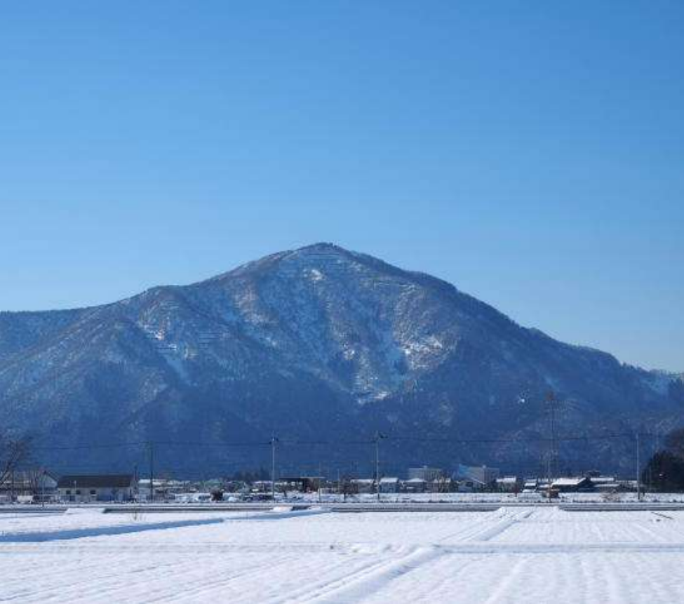
飯降山のおはなし