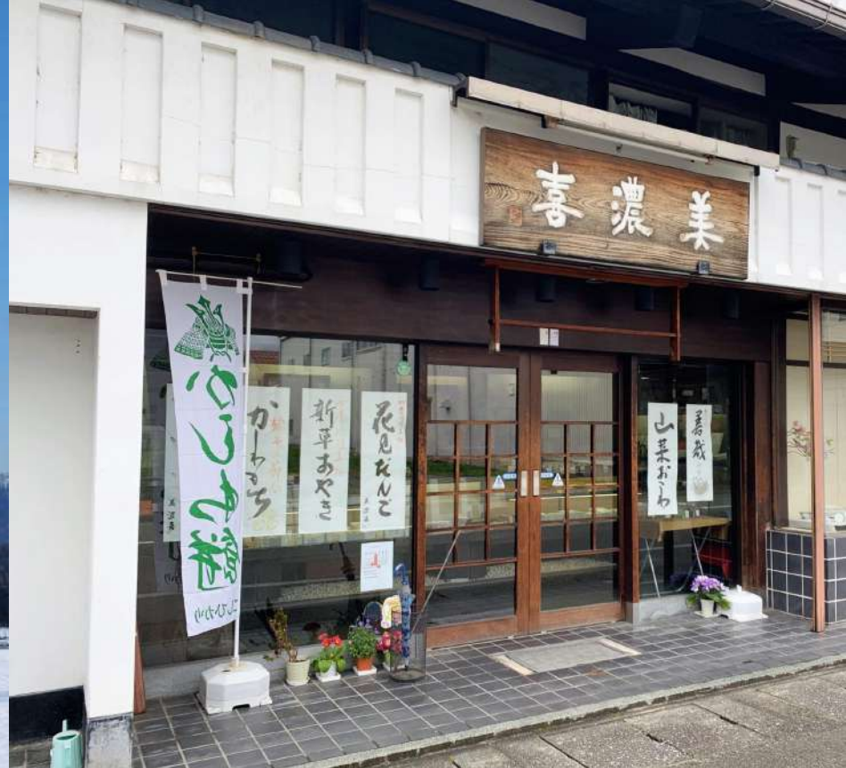
美濃喜のおはなし