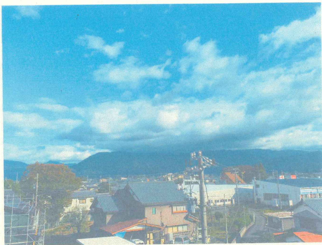
通報時の荒島岳 視程及び雲の状態