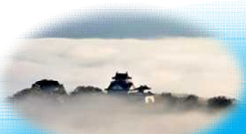
天空の城 越前大野城