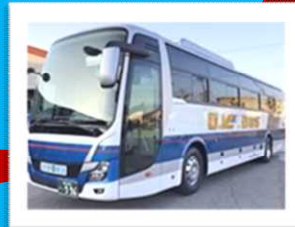
九頭竜湖・夢のかけはし