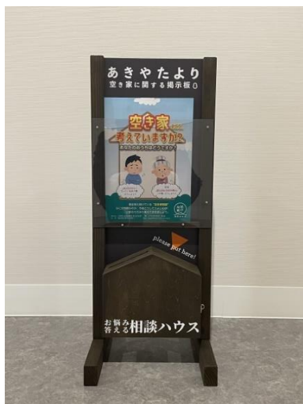
リーフレットスタンド (鍵付きの相談箱も設置)