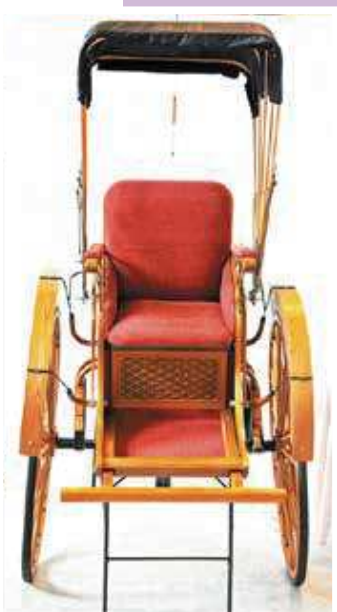
(掲載/第42回展市長賞受賞作品)

井原白雲の如く珠走第1の地味な 善部、在案の百部は白梅、善部は松 実空の多遠里物得る如く 伯珠