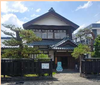
入口は本町通り側にあります。 (所在: 明倫町3-42)