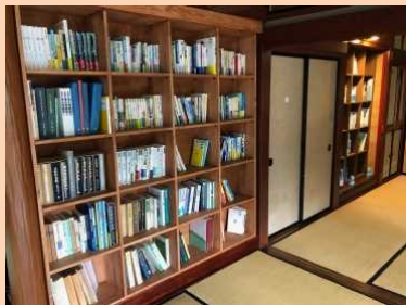
水に関する資料や専門書などを自由に見ることができます。