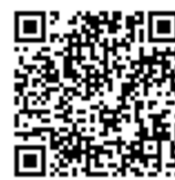
申込用 QR コード

右のQRコードからインターネットで申込みいただくか、 下記の問合せ先に電話で氏名、住所、連絡先を伝え申し込む