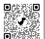
YouTube 視聴用 QR コード