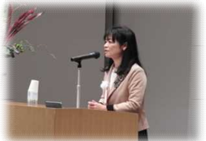
市長からのメッセージ