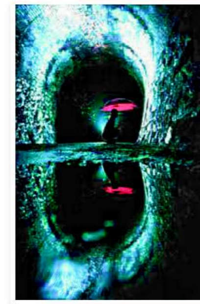
(掲載/第43回展市長賞受賞作品)