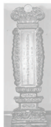
金森長近公位牌 （友兼専福寺 蔵）