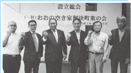
「大野の空き家が大変だ!」 (一社)おおの空き家解決町衆の会