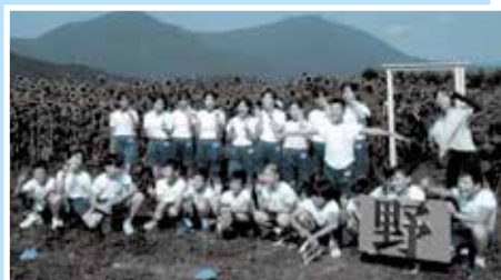
「上庄ニコニコ ひまわりプロジェクト」 上庄小学校6年生チームひまわり