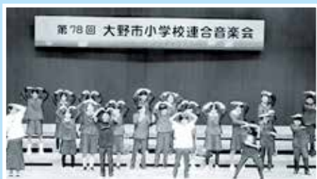
「MMZプロジェクト」 上庄小学校6年生チームMMZ