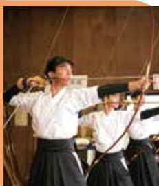
▲真剣な表情で弓を構える弓道部の皆さん

次の目標は夏のインターハイ出場。選抜大会の経験を通過点として、奥越明成高校弓道部は次の一射に向き合っています。