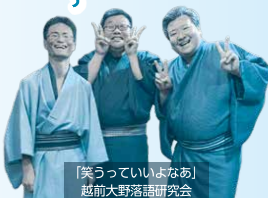
「笑うていいよなあ」 越前大野落語研究会