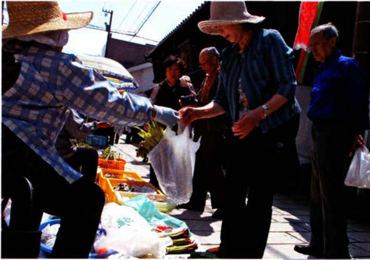
写真上 山菜などの食材を買い求める人たち (山菜フードピア)