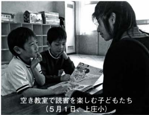
空き教室で読書を楽しむ子どもたち (5月1日、上庄小)

▽地域住民による安全管理員が子どもたちの指導を行う ▽小学校の空き教室などを利用するため、授業終了後、