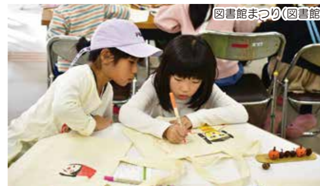
図書館まつり(図書館)