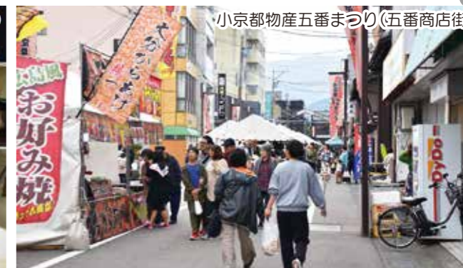
小京都物産五番まつり(五番商店街)