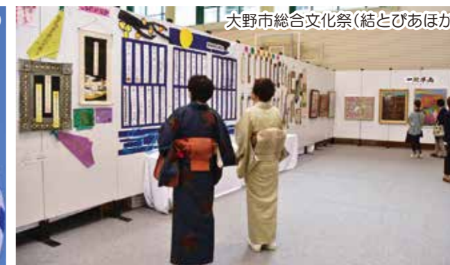
大野市総合文化祭(結とびあほか)