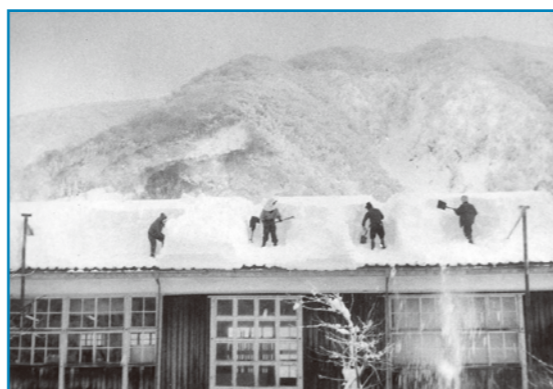
勝原小学校雪下ろし：昭和44年撮影 勝原小学校の屋根雪下ろしを地域の人たちが行っている様子です。人の背丈ほど積もった屋根雪をスコップを使って下ろしています。 (提供：五箇公民館)

大野の歴史・文化・伝統を記録した写真などを収集保存しています。家庭に古い写真などを持っている人は、ぜひ連絡してください。皆さんの協力をお願いします。 ☎ 生涯学習課 (☎65・5590)