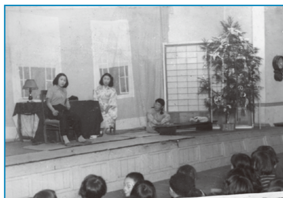
児童劇：昭和25年撮影 大野町公民館で開催されたクリスマス会の児童劇を撮影したものです。舞台上には大きなクリスマスツリーが設置され、たくさんの子どもが劇を楽しみました。