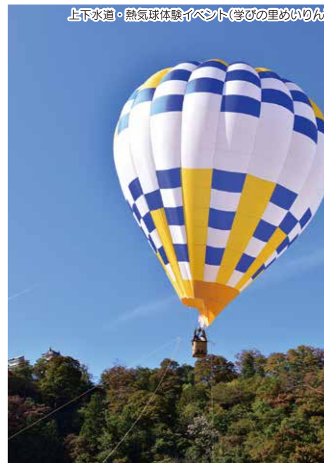
上下水道・熱気球体験イベント(学びの里めいりん)