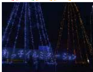
南っ子イルミネーション