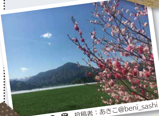
#まいおおの 花 投稿者：あきこ@beni_sashi

普段の暮らしや、大野への旅行で見つけた“まいおおの”。 Instagramに投稿された写真の中から、大野高校の生徒たちがとっておきの1枚を紹介するこのコーナーは、今回が最後です。