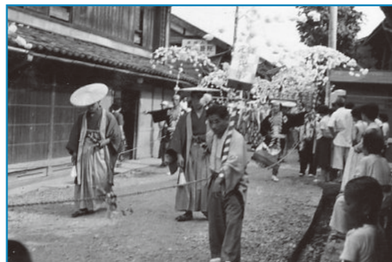
山王神社祭礼：昭和30年撮影 昭和30年の山王神社祭礼で、元禄時代行列一行が練り歩く様子です。沿道には、時代行列を一目見ようと、多くの人で賑わっています。

大野の歴史・文化・伝統を記録した写真などを収集保存しています。家庭に古い写真などを持っている人は、ぜひ連絡してください。皆さんの協力をお願いします。 ☎ 生涯学習課 (☎65・5590)