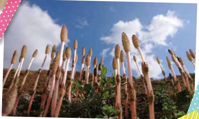
#まいおおの 花 投稿者：tomosan24@kisukedon

昨年7月からスタートした“まいおおのフォトコンテスト”も、ついに最終シーズン！ 6月30日までは「花」「食」「緑」の3テーマで募集中。 皆様のご応募、まだまだお待ちしております！