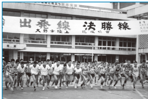
市民マラソン：昭和47年撮影 昭和47年6月18日に開催された第8回大野市民マラソンのスタートの様子です。旧市庁舎前から、勢いよくスタートを切るランナーの姿が印象的です。