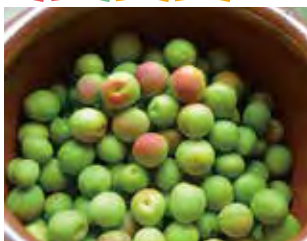
白いと輝きを放つ梅