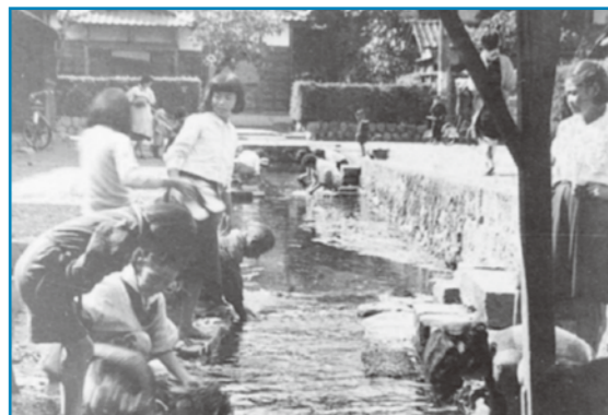
おしよらず御清水：昭和30年撮影 手前から奥へと水が流れていて、上流では野菜を洗い、下流では洗濯をするなど、御清水とともに生活する人々の様子がうかがえます。