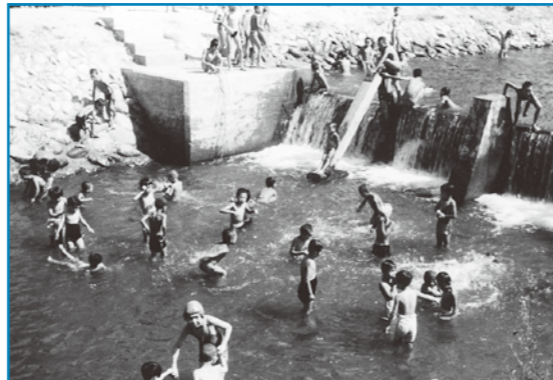
川遊び：昭和16年撮影 学校にプールがない時代に赤根川で子どもたちが川遊びをしているところです。躍動感あふれる子どもたちの様子から、川遊びの楽しさが伝わってきます。

大野の歴史・文化・伝統を記録した写真などを収集保存しています。家庭に古い写真などを持っている人は、ぜひ連絡してください。皆さんの協力をお願いします。