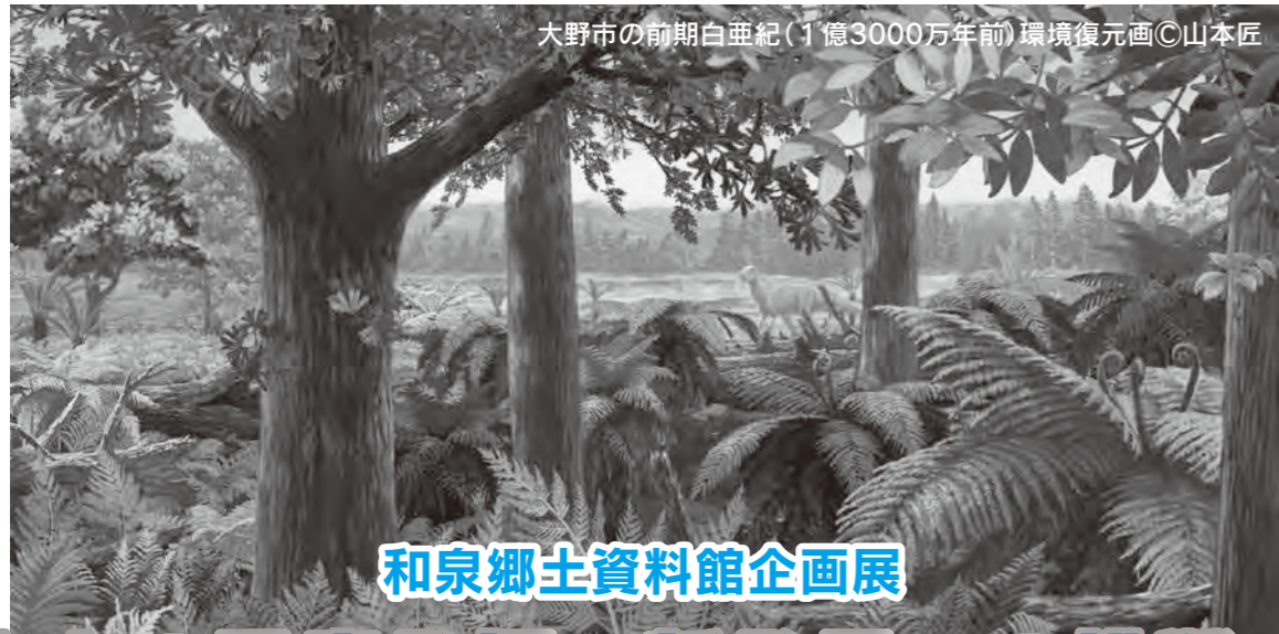
大野市の前期白亜紀(1億3000万年前)環境復元画©山本匠