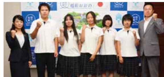
7月22日訪問、第66回全国高等学校ワープロ競技大会に出場する奥越明成高校ビジネス研究部員の皆さん

各大会の地元大会を勝ち抜き、全国大会に出場する子どもたちが市長を訪問し、それぞれの大会での活躍を力強く宣言しました。