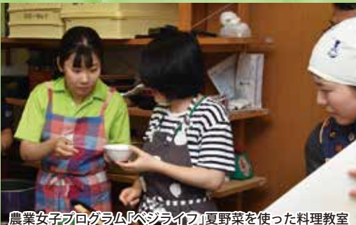
農業女子プログラム「ベジライフ」夏野菜を使った料理教室