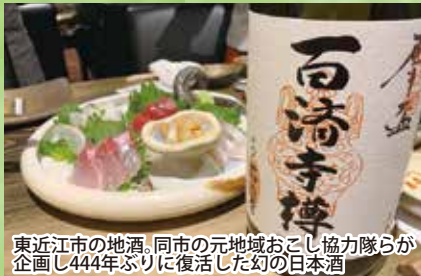
東近江市の地酒、同市の元地域おこし協力隊らが企画し44年ぶりに復活した幻の日本酒