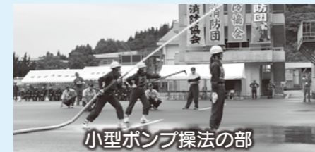
小型ポンプ操法の部

ポンプ車操法の部 本市消防団が 大会4連覇の快挙 7月20日(土)に県消防学校で第68回県消防操法大会が行われ、和泉地区を管轄する第9分団がポンプ車操法の部で優勝、結の故郷女性分団が県内で唯一の女性チームとして小型ポンプ操法の部に出場し、6位に入賞しました。これにより、ポンプ車操法の部は本市消防団が4年連続して優勝する快挙を成し遂げました。 消防署予防課 (☎64・4898)