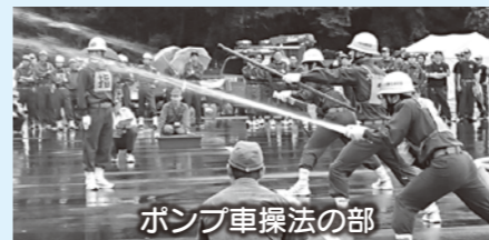
ポンプ車操法の部