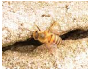
日本在来種 ニホンミツバチ

編集後記 小矢戸で取材をしていたとき、地区の人から「ちよっとした自慢があること。案内されたのは野生のニホンミツバチの巣。性格がおとなしくむやみに攻撃してこないニホンミツバチは、昔はどこでも見られたのに、蜂蜜が量産できる西洋ミツバチが輸入されてから、めっきり数を減らしていること。ちよっとした自慢とは、ここが自然豊かである証拠」でした。