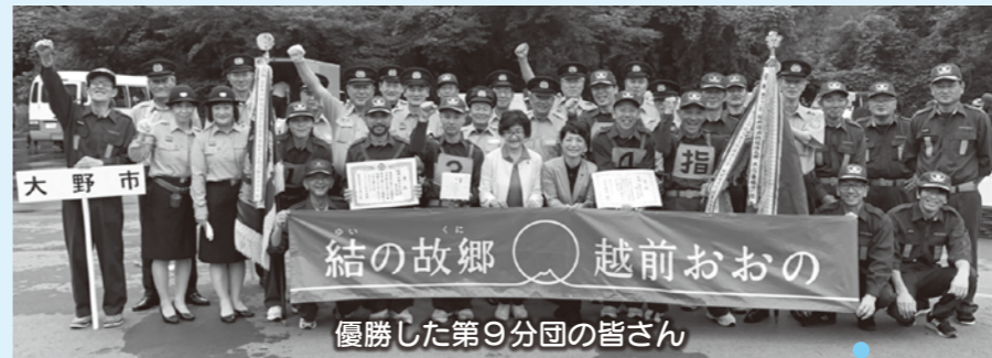
優勝した第9分団の皆さん