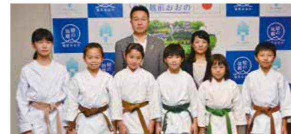
7月22日訪問、第19回全日本少年少女空手道選手権大会と第55回和道会全国空手道競技大会に出場する大野市空手道スポーツ少年団の皆さん