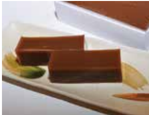
大野の冬の味覚 「どっち羊かん」