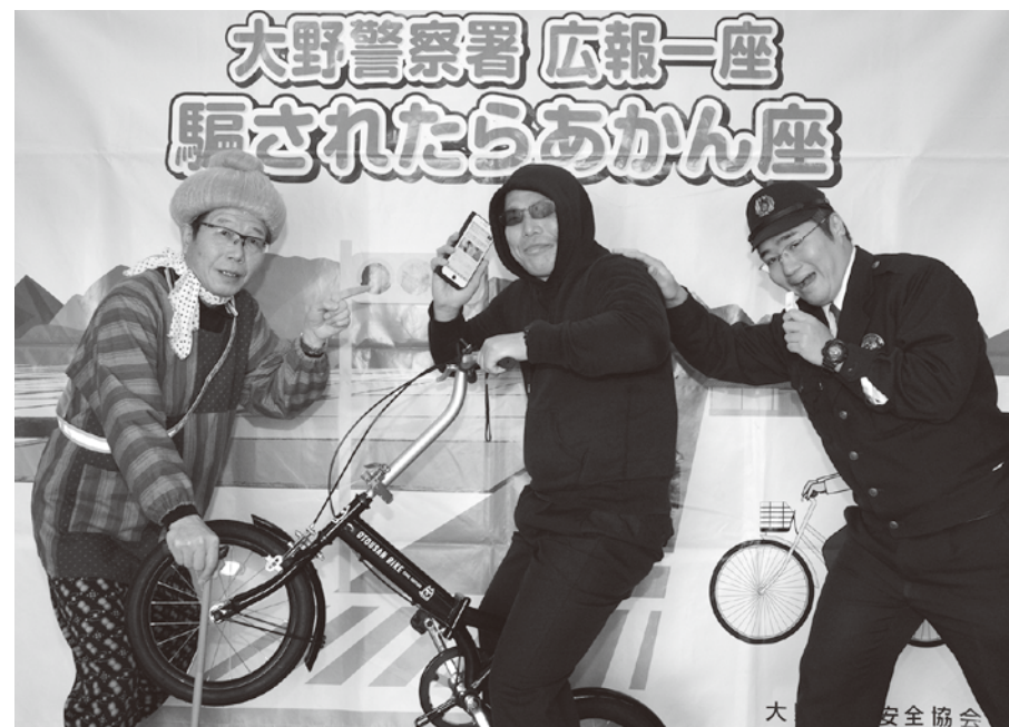
騙されたらあかん座