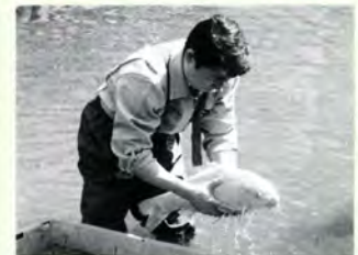
新堀川にもどったコイ