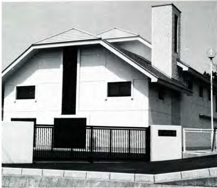
南六呂師の排水処理施設

近年の農村を取り巻く環境は大きく変わってきました。生活様式の多様化・高度化に伴い、生活雑排水による水質悪化が進む一方で、トイレの水洗化など近代的で快適な生活への要望も強くなってきています。こうしたことから市では、農村の生活環境の整備と河川の汚濁防止を図るため、農業集落排水事業を計画的に進めています。ひと足先に完成している阿難祖・佐開に続いて今春、南六呂師と下唯野も供用開始となりました。今月はこの事業のあらましを紹介します。