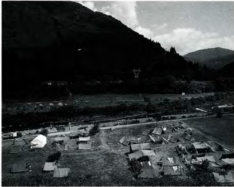
利用者が増えている麻那姫湖青少年旅行村

平成六年の観光客動向調査が、このほどまとまりました。昨年一年間に当市を訪れた観光客は、七十六万六千三百人で、前年よりも八万六千五百人増えており、過去十年間で最高となりました。 観光地別では、最も人気があったのは市街地で二十七万五千五百人。次に六呂師高原の