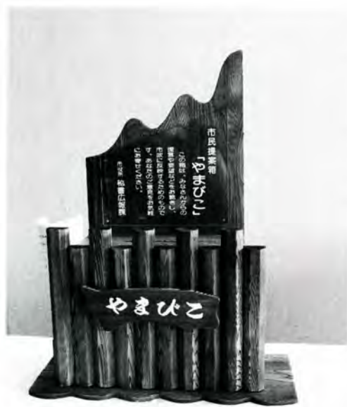
やまびこをイメージして作られた提案箱

このメッセージは、あらかじめテーマを決めて行います。応募作品は有識者を交えた審査会に諮り、優秀作は表彰します。また、具体的に取り組めるものは、予算化などをしていく考えです。