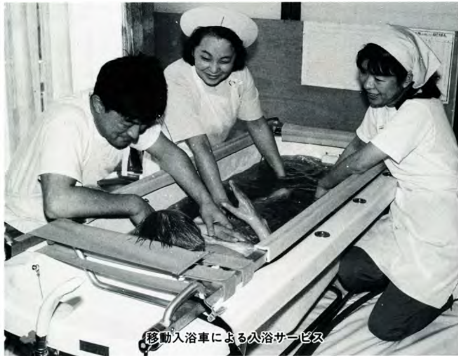
移動入浴車による入浴サービス

寝たきりや重い障害などで、家庭のふろが使いにくい場合に、移動入浴車が訪問して入浴サービスを行っています。現在、二台の車があり、希望者は月二回の利用ができます。若干の利用料金が 필요합니다。また、社会福祉協議会でも和光園で入浴サービスを実施しています。