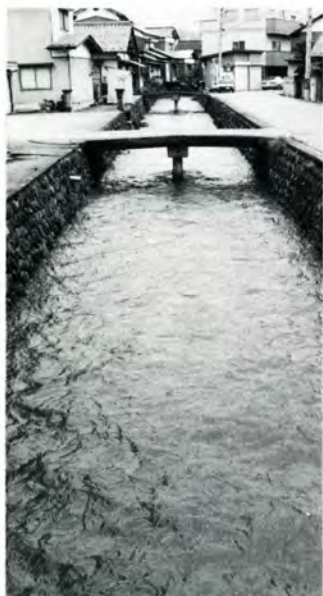
汚れが目立つ市街地の川

市では本年度、一部の市街地河川で木炭や波トタンを使った浄化対策を試みる予定です。しかし、一番の対策はできるだけごみや汚水を流さないことです。川に対する思いやりをお願いします。