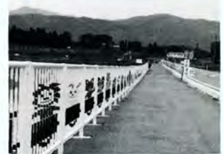
防護さくに絵（田野）