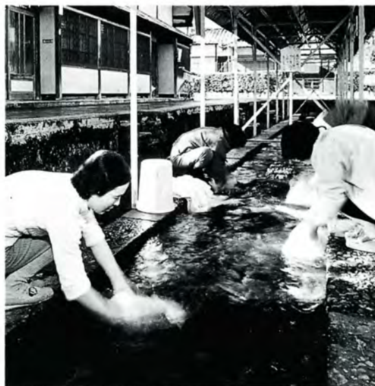
年中、水が豊富だったころの 20年余り前の「御清水」