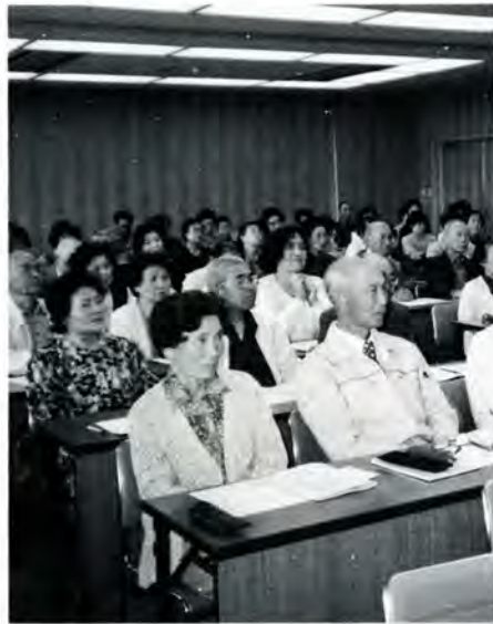
参加者に好評の市民大学

七月開講の予定で、塾生は約三十人を募集します。対象は社会人で、地域活動に意欲と関心があり、勉強したい人