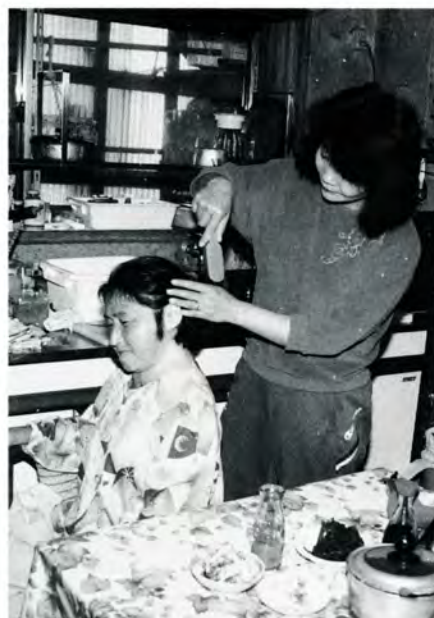
親身になって介護するヘルパー