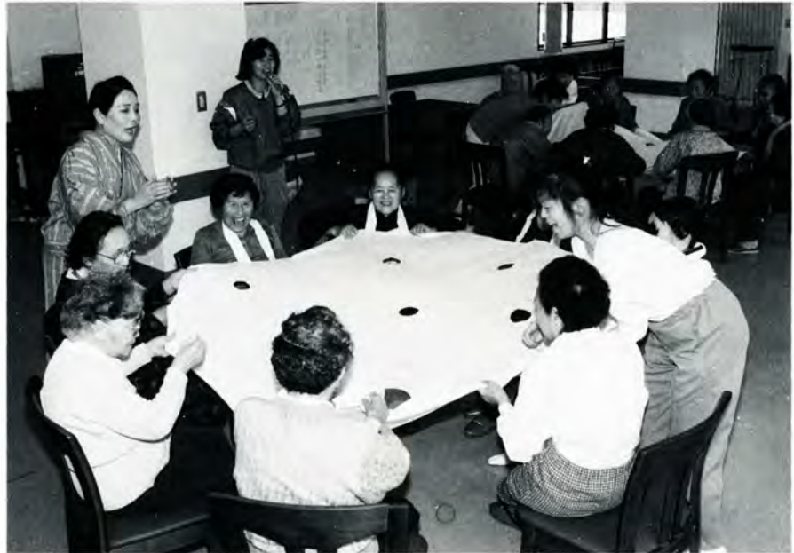
みんなで楽しくゲーム (一乗ハイツのデイサービス)

詳しいことは福祉事務所へお尋ねください いかがですか。あなたはいくつのサービスをご存じでしたか。サービス内容について、もっと詳しくお知りになりたい人は、お気軽に福祉事務所へお尋ねください。 ☎66-11111内線474