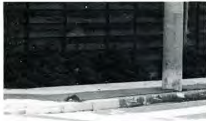
して、ご理解とご協力をお願いします。(建設課長)

例示いただいた交差点の歩道は、先月に改良工事の発注を行いました。今月末には完成の予定ですので、今しばらくお待ちください。今後とも道路行政に対しま