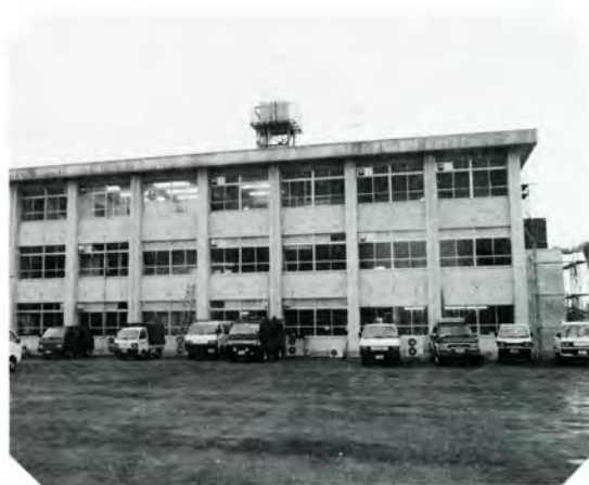
オープンを待つ大野公民館（12月15日撮影）

旧大野高校定時制校舎を再利用した、大野公民館の移転改修工事が終わりました。新年からは新しい場所で業務を始めます。