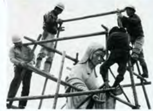
麻那姫像も冬支度