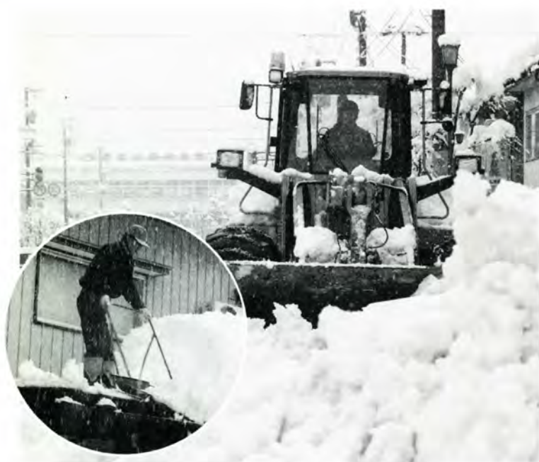
雪国のルールを守って快適な冬に