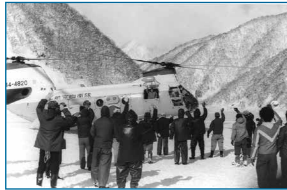
五六豪雪 救助ヘリ：昭和56年撮影 五六豪雪によって旧和泉村が孤立したとき、航空自衛隊のヘリコプターが食料や生活必需品などの救援物資を輸送しました。多くの人が感謝の気持ちを込めて手を振っています。

大野の歴史・文化・伝統を記録した写真などを収集保存しています。家庭に古い写真などを持っている人は、ぜひ連絡してください。皆さんの協力をお願いします。 ☎ 生涯学習・文化財保護課(学びの里「めいりん」内) ☎65・5590