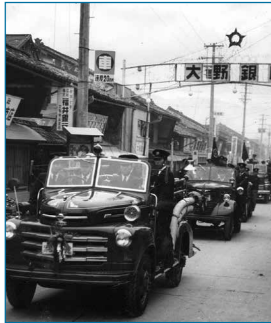
出初め式の行進：昭和31年撮影 昭和31年1月、出初め式で消防車が三番通りを行進しています。消防車のナンバープレートの上には、しめ縄が飾られています。この年はまだ降雪がなかったようで、1月とは思えない風景です。