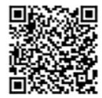
▲申し込みはこちら

格闘技未経験者大歓迎です。みんな楽しく思いっきり汗を流しましょう。 日時 1月13日、20日、27日(いずれも全3回)午後7時～8時 場所 エキサイト広場総合体育施設 内容 キックボクシングのジャブやアッパー、キックなどを組み合わせたコンビネーションで体全体を動かします 講師 生涯体育学習振興機構 対象 20～50歳の市民 定員 20人(先着) 受講料 500円(保険料込み) 持ち物 タオル、飲み物、内履き 服装 運動のできる服装 申込方法 専用フォームまたは電話で申し込む 申込締切 1月10日 図 スポーツ推進課 (☎65・5592)