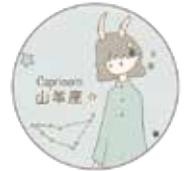
イラスト：望月詩織

ギリシャ神話では、神々がナイル川のほとりで宴会をしていたとき、突然怪獣テュフォンが現れ、 カプセル 牧畜の神パーンは魚に化けてナイル川に飛び込んで逃げようとした。しかし、慌てていたため、上半身がやぎで下半身が魚の姿になってしまったといわれています。