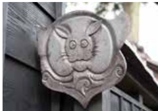
丸くてかわいい ウサギの瓦

今年の干支は「卯」。かわいい小動物のイメージが強いウサギですが、動きが俊敏なことや繁殖能力が高く子孫繁栄を連想することなどから、戦国時代には縁起の良い動物として多くの武士に好まれていたそうです。 武家屋敷旧内山家には、所々にウサギの文様が施された瓦が設置されています。ウサギが何羽いるか、ぜひ見つけに来てください。