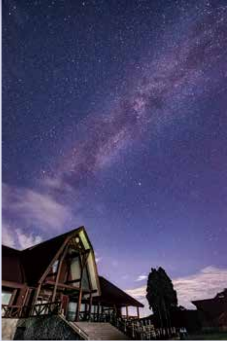
今月の星空スポット 六呂師高原

日本一のきれいな星空は大野の宝です。この星空を守り、未来へ受け継ぐ取り組みなどを今月から12回シリーズで紹介しします。