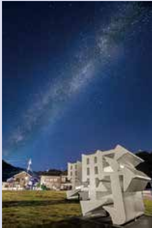
今月の星空スポット 大野地区

大会では、記念講演や開催地の団体による環境保全に関する発表などが行われます。優れた環境保全や普及啓発活動などを行った団体と個人に、環境大臣賞や「星空の街・あおぞらの街」全国協議会長賞などが授与されます。 ※本大会の参加受け付けはすでに終了しています