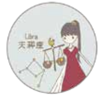
イラスト：望月詩織

ギリシャ神話 はるか昔、神々と人間は一緒に暮らしていましたが、人間が武器を持って争いを繰り返すようになり、神々は天へ引き上げてしまいました。ただ一人この世に留まったのが、正義の女神アストレアで、彼女は人間の正義を測るために天秤を使い、正義を説いたり、悪を退けたりしました。しかしそのアストレアさえもついに人間社会の悪に嫌気が差し、天に去って星座になったといわれています。