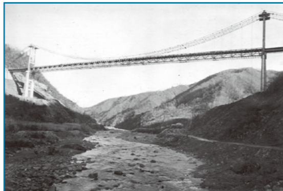
夢のかけはし：昭和43年撮影 九頭竜湖にかかる「夢のかけはし」の正式名称は箱ヶ瀬橋です。瀬戸大橋の試作として建設されたこの橋の周辺では、例年4月下旬には桜が、10月下旬には紅葉が見頃を迎えます。

大野の歴史・文化・伝統を記録した写真などを収集保存しています。家庭に古い写真などを持っている人は、ぜひ連絡してください。皆さんの協力をお願いします。 ☎ 生涯学習・文化財保護課（学びの里「めいりん」内）☎65・5590