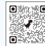
▲詳しくはこちら (ちっく・たっくホームページ)