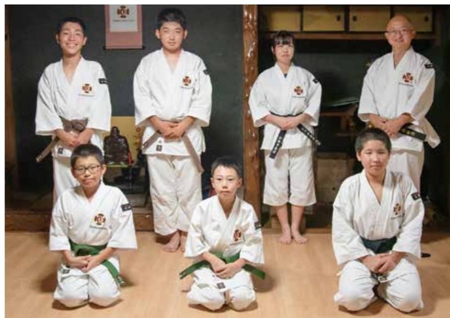
金剛禅総本山少林寺大野城南道院