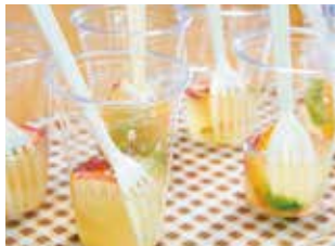
新たな大野グルメ開発中!

編集後記 開発中の食べ歩きグルメ「越前のおのワンハンドグルメ」の試食会の取材に行ってきました。試食会では13の試作品が並び、参加者からは「見た目がカラフルでかわいい」「味がもつと濃い方が好み」などさまざまな感想が寄せられていました。食品は改良を重ね、来年2月の完成を目指します。新たなグルメを片手に大野のまちを散策するのが楽しみです。