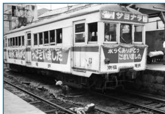
京福電車：昭和49年撮影

大正3年4月に越前電気鉄道として開通以来、約60年間運行された越前本線「勝山～京福大野」間が昭和49年に廃線となりました。