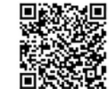
▲申し込みはこちら