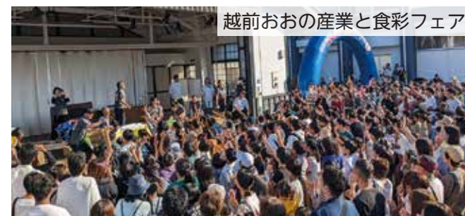
越前おおの産業と食彩フェア

中部縦貫自動車道勝原IC～九頭竜IC間が開通した今秋、市内各地で多彩な催しが行われました。