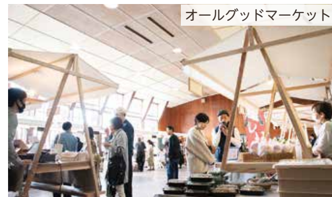
オールグッドマーケット