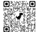
▲申し込みはこちら