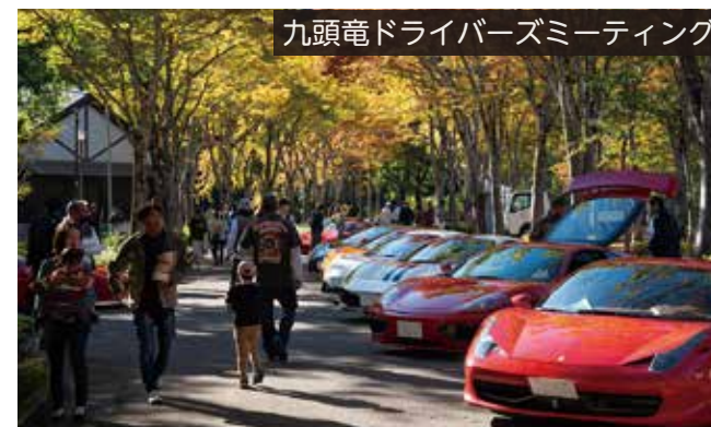
九頭竜ドライバーズミーティング