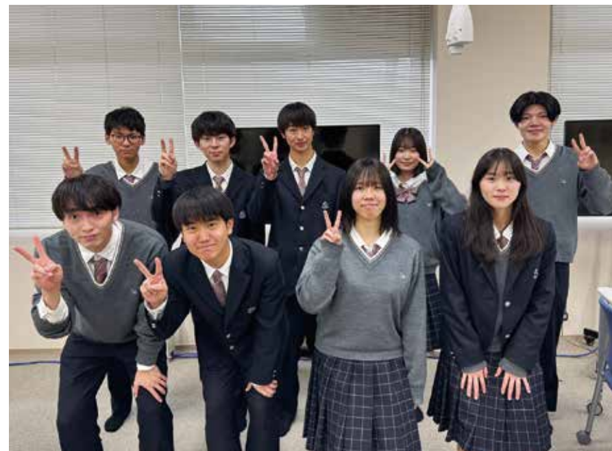
奥越明成高校ビジネス情報科3年生