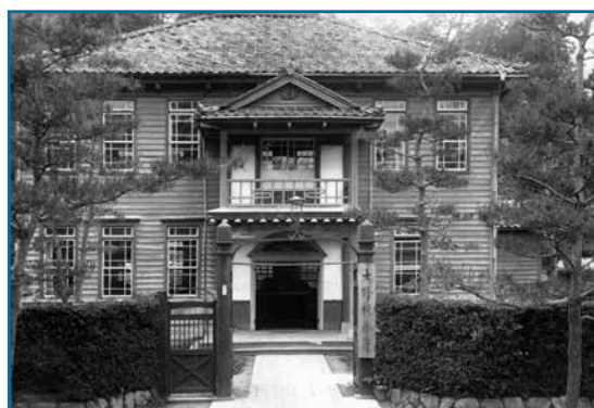
旧大野税務署：昭和29年撮影

正面2階にベランダが設けられた、とても趣のあるレトロな建物です。旧大野税務署は昭和34年に建て替えられました。