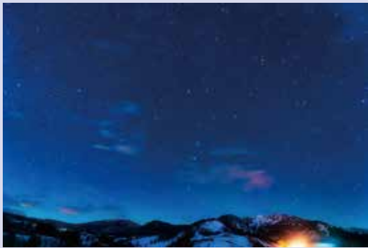
今月の星空スポット 六呂師高原

そこで、星空保護区認定制度のさらなる浸透や星空の環境保護意識の醸成、各地域への誘客を図ることを目的に、国内で星空保護区に認定された地域(沖縄県石垣市、竹富町、東京都神津島村、岡山県井原市)と連携することになりました。その第1弾として、それぞれの認定地の取り組みや魅力を紹介する共同パンフレットを製作しました。今後も連携して全国へ星空保護についてPRしていきます。