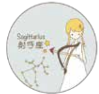
イラスト：望月詩織