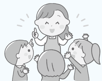
◎祝日・休日の場合を除く。詳しい内容は、各園に問い合わせてください

いなやまこども園 毎週 午前10~11 なないろ広場 18日 午前10~11※クリスマスの製作、保育教諭による子育て相談 いなほこども園 毎週 午前10~11 なないろ広場 4日 午前10~11※クリスマスの製作、保育教諭による子育て相談 大野幼稚園 毎週 午前9:30~11:30 きらきらClub 5日 7日 12日 14日 午前9:30~11:30 ※親子ふれあい遊び、絵の具遊び、園児との交流遊び、絵本の読み聞かせ、保育心理士による子育て相談 開成こども園 毎週 午前9:30~11 にこにこ広場 今月はありません 上庄こども園 毎週 午前9:30~11 ころころ広場 今月はありません 亀山こども園 毎週 午前10~11 かめさん広場 12日 午前10~11※クリスマスの製作 篠座こども園 毎週 午前10~11 子育て広場 8日 午前10~11※室内遊び 誓念寺こども園 毎週 午前9:30~11 なかよし広場 7日 午前9:30~11 誓念寺中野こども園 毎週 午前9:30~11 なかよし広場 14日 午前9:30~11