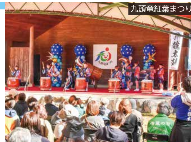
九頭竜紅葉まつり