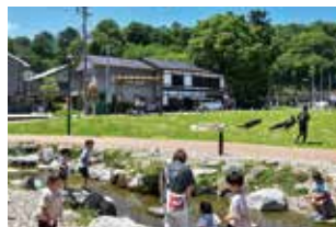
まちなかにできた憩いの場