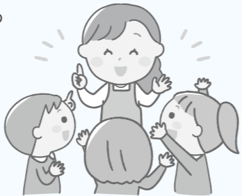
◎祝日・休日の場合を除く。詳しい内容は、各園に問い合わせてください