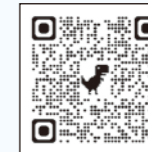
▲詳しくはこちら (ちっく・たっくホームページ)

♪子育て塾~マイスターによる身体測定と育児相談~※要予約。母子手帳をご持参ください