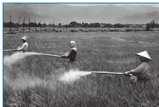
農薬散布：昭和30年撮影 稲の生育に有害な稲熱病の対策として、農薬散布機を使って消毒作業をしている様子です。この年は下舌、中野、田野など多くの地区で稲熱病が発生しました。