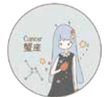
イラスト：望月詩織

ギリシャ神話では、大かにの仲間のヒドラがヘラクレスと戦っていた時、ヒドラが負けそうになったため、ヒドラを助けようと大かにがヘラクレスの足を挟もうとしましたが、逆に踏み潰されてしまいました。それを見ていた女神ヘラが、友達思いの大かにを天に上げ、かに座になったといわれています。