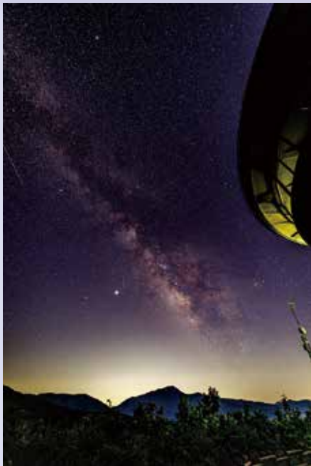
今月の星空スポット 南六呂師地区

日本一美しい星空は大野の宝です。この星空を守り、未来へ受け継ぐ取り組みなどを12回シリーズで紹介します。