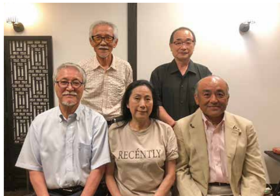
魅せる城下町を創造する会