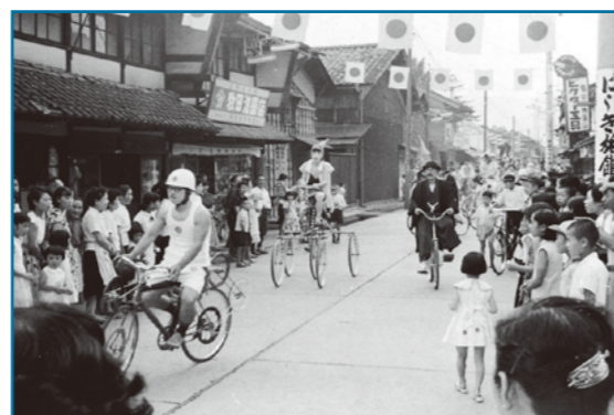
大野市制5周年祭：昭和33年撮影 大野市制5年をお祝いする商店街の祭りです。自転車組合による仮装・変わり種自転車が祭りを盛り上げ、多くの人々が楽しそうに眺めています。

大野の歴史・文化・伝統を記録した写真などを収集保存しています。家庭に古い写真などを持っている人は、ぜひ連絡してください。皆さんの協力をお願いします。