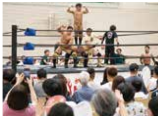
歓声がリングに渦巻く!

8月15日夜、結びぴあで開催されたドラゴンゲートプロレス in 大野の取材に行きました。選手の力強く華麗な技の応酬に、約300人の観客が歓声で呼応し、選手と観客が一体となって会場を湧かしました。 人々をつなぎ、見る人に元気を与えるというスポーツの力を再確認した夜でした。