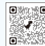
詳しくはこちら (ちっく・たっくホームページ)