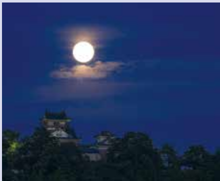
今月の星空スポット 越前大野城と満月

積雪の影響のある冬期を除き、天の川が見やすいとされる20等級を上回る21等級台であり、美しい星空であるということがデータからも証明されています。