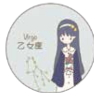
イラスト：望月詩織

収穫の神デメテルの娘ペルセポネが、冥土の神ハデスにさらわれ、デメテルが悲しみ、ほら穴に閉じこもると、草木や花が枯れました。それを見かねた大神ゼウスがペルセポネを救い、大地は緑に覆われましたが、ペルセポネがハデスにだまされて、ザクロの実を食べ、1年の3分の1を冥土で暮らす羽目になり、娘のいないこの時期は、デメテルは悲しみ大地は枯れ果て、これが冬となり季節の始まりとなったといわれています。