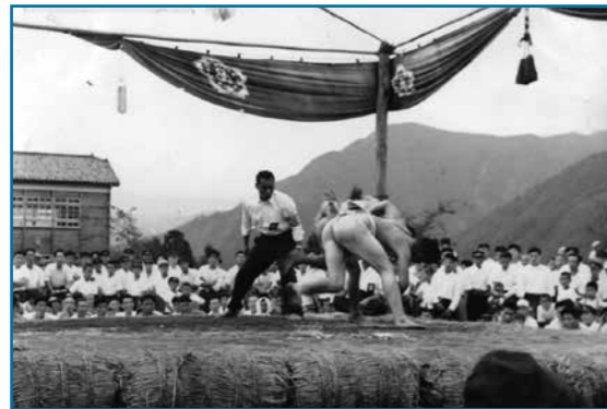
若越青年体育大会：昭和29年撮影 市制施行祝賀行事の一環として本市で若越青年体育大会が開催されました。有終中学校グラウンドで行われた相撲競技を多くの学生が見守っています。