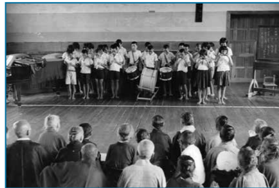
乾側地区敬老会：昭和35年撮影 地区の敬老会が乾側小学校の講堂で開催されました。子どもたちの奏でる大太鼓や小太鼓、縦笛の演奏に、お年寄りたちが耳を傾けています。

大野の歴史・文化・伝統を記録した写真などを収集保存しています。家庭に古い写真などを持っている人は、ぜひ連絡してください。皆さんの協力をお願いします。