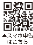
▲スマホ申告はこちら

給与所得がある人、年金収入や副業などの雑所得がある人などは、マイナンバーカードを利用していつでも行える、スマートフォン(スマホ)での申告が便利です。 青色申告決算書や収支内訳書、消費税の申告書の作成にも対応しています。 ぜひスマホ申告をご利用ください。