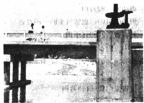
(完成した護岸とあげの橋=稲郷)

出たため、6千900万円の追加工事を進めたため、このほど20年ぶりに改修工事が終り