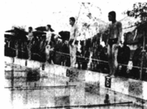
(プール開きの一コマ)