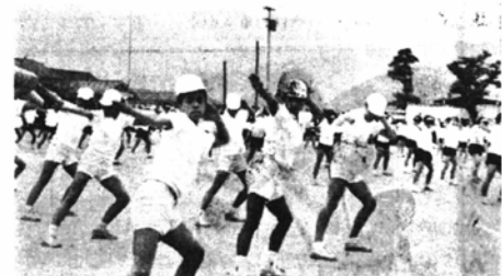
(下庄中生による徒手体操)

この日小学校の鼓笛隊、中学校のブラスバンドを先頭に市中行進を行ない、午後2時打ち上げ花火を合同に開会宣言。参加者全員によるラジオ体操で開始され幼稚園の遊戯、リズム運動、徒手体操、職場体操、そろいのゆかたに着飾った婦人会のごぜん踊り、など多彩な演技を心気いっばいにくりひろげて観衆の絶賛を浴びました。