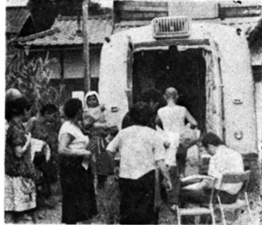
(レントゲン車の巡回検診)

昨年の受診者数は該当者1万9千868人のうち1万6千人で受診率80.5%、受診の結果、精密検査をおこなった方556人、結核患者55人、発病のおそれあるものと