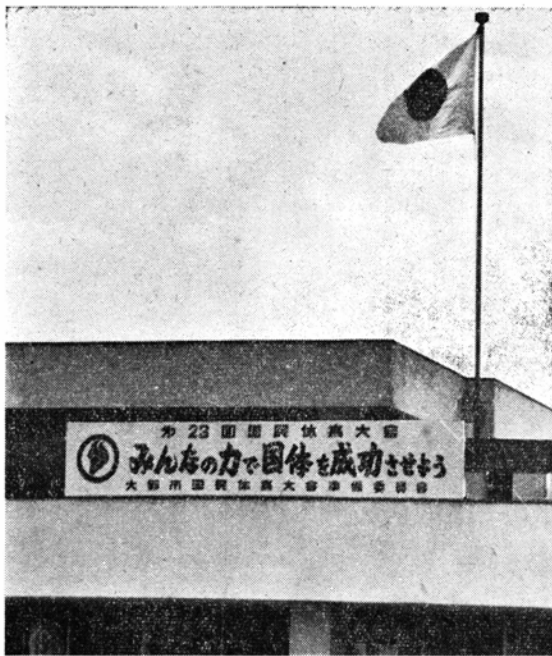
(全日ソフトは国体への道)