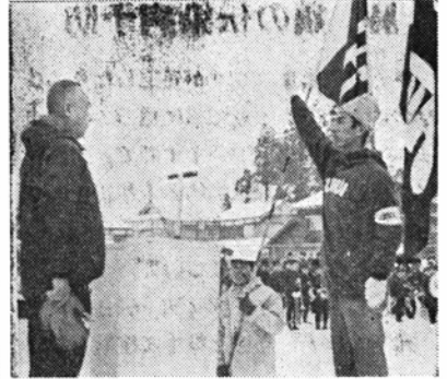
5位 石川県 77点、6位 三重県 2.5点