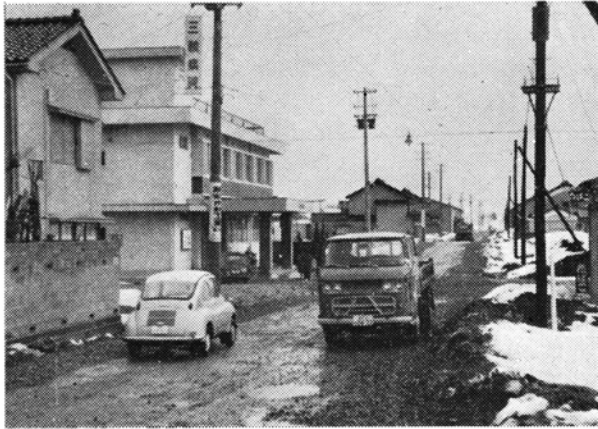
(写真は整然と建ち並んだ美川町一区)

駅東土地区画整理事業は、昭和34年度から7カ年継続で、総事業費7千929万7千円で宅地造成につとめてきましたが、この3月末には整然とした町になります。