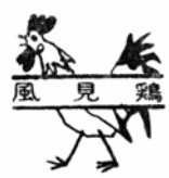
十二月の世界の名曲の中におなじみの「庭の干草」がある。「庭の干草」も虫の音も、枯れてさびしくなりけり...

十二月の世界の名曲の中におなじみの「庭の干草」がある。「庭の干草」も虫の音も、枯れてさびしくなりけり...」曲はアイルランド民謡だが、明治十七年に里見義氏の作詞となり発表された。この歌詞の二番に「ああ、あわれあれ、ああ白菊、人のみさおもかくてこそ」とあるが、明治は遠くなりにけり之感がひとしお深い。名作「ピルマの緊要」の中に歌われた日本の歌う小隊の歌でもある。▼十二月と共に奥越は冬將軍がやってくる。北欧スエーデンが生んだ文豪アンデルセンの「マッチ売りの少女」ははなやかなジングルベルとは対照的に、雪国のもつ貧しく清き悲しい天使をほうふつさせるに足る。アメリカ民謡となるとまた違う。西堀栄三郎作詞なる「雪山讃歌」は今日の雪のイメージを変えた。「荒れて狂うは吹雪かなだれ、俺たちそんなもの恐れはせぬぞ」▼わが国の冬のわらべ唄にはいいものが多い。「雪やこんこんあられやこんこん」はいまもコタツで歌われている。「もういくつねとお正月は」子どもの現実に対する夢や関心を育てるに足る力があったことは、この作品が明治三十四年であったにかかわらず今日まで生きていることをふみよみよめる。しかし手まり唄の「ひいふみよ」は今日のゴムまり唄では実感が湧かないし、「通りやんせ通りやんせ」のわらべ唄と同じように、いまではしだいに忘れられていく傾向にある。▼歌は心の表現だが、おみそかの紅白歌合戦だけが世の関心事ではさびしい。年末は何かと殺ばつとしてむなしくまたいそがしい。交通事故や火災のサイレンが泣くようになりまたに、いまわしい犯罪のニュースがこれ以上加わってはたまらない。「雪国」の