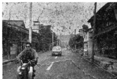
(舗装工事の完成した一番線)