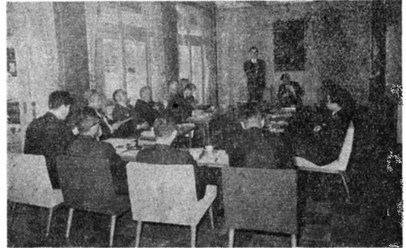
広域行政を話し合う各市村の代表者

この結果、大野市長が会長に選ばれ委員は各市村の長・議長・助役・教育長の12名とし、協議会発足の日は、1月28日と決めました。