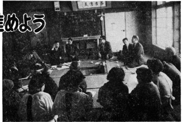
将来の生活設計を真剣に話し合う六呂師の人たち

現代社会は物質的な生活が満たされた反面、人間らしい情操豊かな生活がむしろみられつつあります。