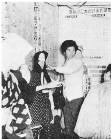
生活改善の展示を見る主婦たち(昨年)

▷青果物即売会 10日～11日 品評会ほかに、広く一般農家から新鮮な野菜をたくさん出してもらい販売します。消費者のみなさんの期待にじゅう