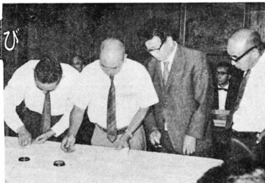
契約書に調印する各森林組合長

市内の上庄・小山・阪谷・五箇の4つの森林組合が大同合併して、大野市森林組合をつくらうと、ことしの1月21日、大野市森林組合合併促進協議会が結成されました。