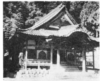
市内で最古の黒谷観音

い所から石罫 いしがこ が発見され、その中から銅製の筒(保元2年-1157の銘あり)を入れたかめや鏡など17点が見つかりました。これらは、いま東京の国立博物館に保存されています。