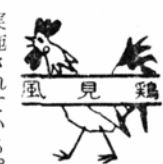
風見鶏 昭和二十三年七月二十日新しい祝祭日が定められて、五月五日の端午の節句を「こどもの日」とし、翌年から

昭和二十三年七月二十日新しい祝祭日が定められて、五月五日の端午の節句を「こどもの日」とし、翌年から実施されている。この日はこどもの人格を尊重し、その幸福をはかり、あわせて両親に感謝するというのが主旨で、それにそったこども中心のいろいろな行事が行なわれることも恒例となった。このことは大変結構なことであるが、こどもの家庭教育問題についての反省も真剣に検討されるときでもある。・父として働き帰るこどもの日(仲秋)▼こどもの成長を象徴するかのように、五月鯉がからだ一ぱいにすがすがしい風をはらんで青空を泳いでいるのを見ると、誰でも快い初夏を強く印象する。・鯉のほり一郷のあること示す(端鳥)▼端午の節句の前夜、軒に菖蒲(しょうぶ)をふく風習はいまも残っている。これは平安中期に宮廷で起こったというが「この日より盛夏になりて毒虫多く生じ人家に入らむとする故軒端にもぎ菖蒲を、その他虫を除くべき草木を軒にふくことなど言々」と古書にある。いずれも邪気を払い、火災を避けるまじないであった。・一屋に馬と住み合い菖蒲茸(しよぼう)現代ではこれを公害対策のまじないにでもしたらどうだろうか。植物という優しいものから生きた教訓を与えられれば人間疎外から救われるというもの。▼菖蒲酒はいま作りたしなむ人はないにしても、菖蒲湯が残っていることはありがたい。五月の薫風がその菖蒲にこもって、ふくいくとした香とともに湯にしみるとき、優しくかつた母を不思議に思い出す。・菖蒲湯に端然と胸