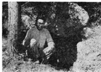
大矢戸の横穴式石室古墳