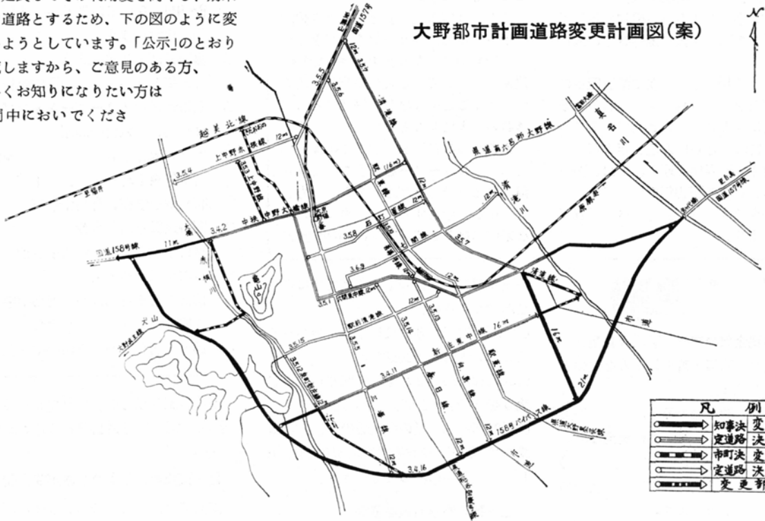
大野都市計画道路変更計画図(案)

縦覧の期日 8月1日~15日 場 所 大野市役所建設課 時間は午前8時30分から午後5時まで。土曜日は午前11時30分まで。ただし、日曜日は縦覧しません。